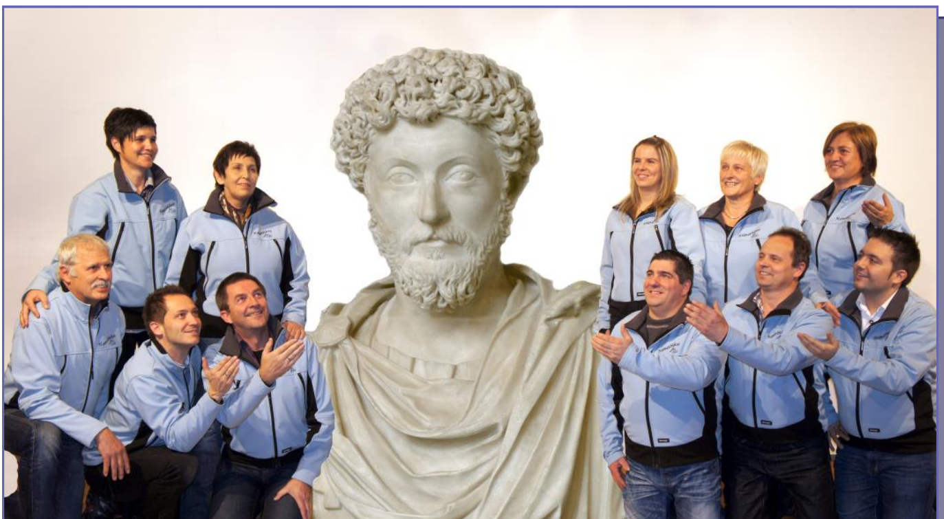
Der Cäsar und die Beautyfarm

Die HBS See wünscht allen ein frohes Weihnachtsfest und einen guten Rutsch ins neue Jahr