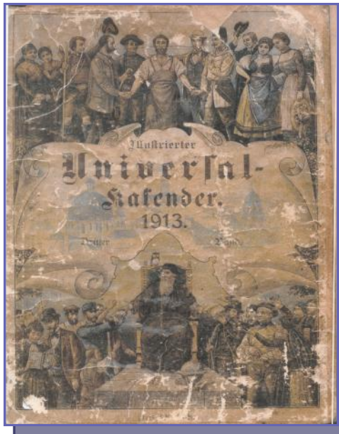
Deckblatt des illustrierten Universalkalenders von 1913