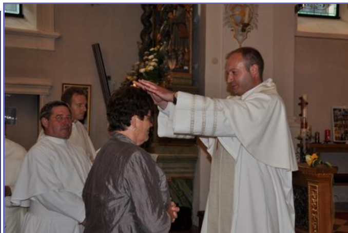
Empfang des Primizianten und Primizsegen