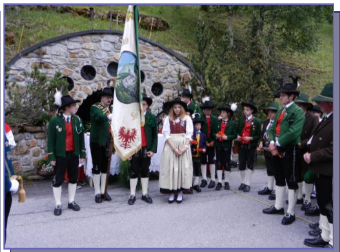
Messe bei der Lourdeskapelle

Im Anschluss wurde im Hotel Mallaun die Preisverteilung des Kompanievergleichsschießens in Valzur sowie die Verleihung der Jungschützen-Leistungsabzeichen vorgenommen.