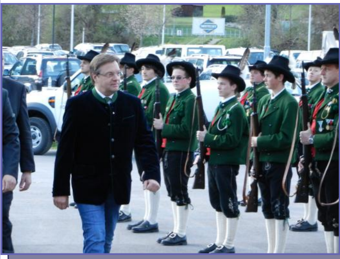
Landesüblicher Empfang mit Landeshauptmann Günther Platter

vom Fleischhof Oberland zum Agrarzentrum Imst, erfolgte gemeinsam mit der Schützenkompanie Silz und der Musikkapelle Karres der landesübliche Empfang und die Ehrensalue für Landeshauptmann Günther Platter.