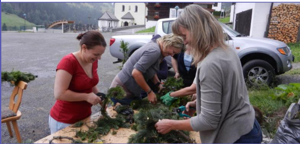
Vorbereitung zu den Kranzarbeiten