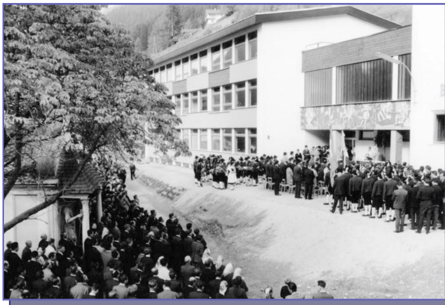
Eröffnung der neuen Hauptschule 1967