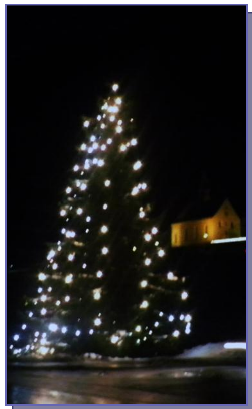
Christbaum Dorfeinfahrt 2011