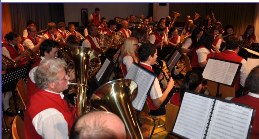
Frühjahrskonzert 2012