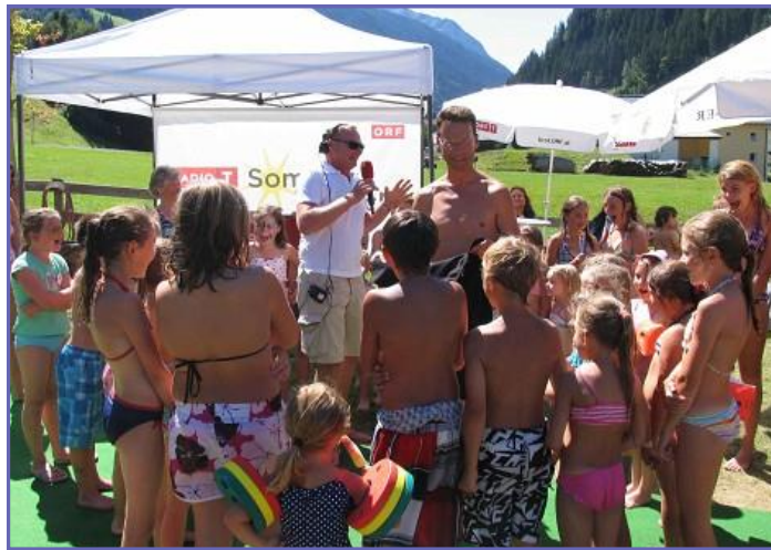
Gerhard Berger mit Seaber Kindern