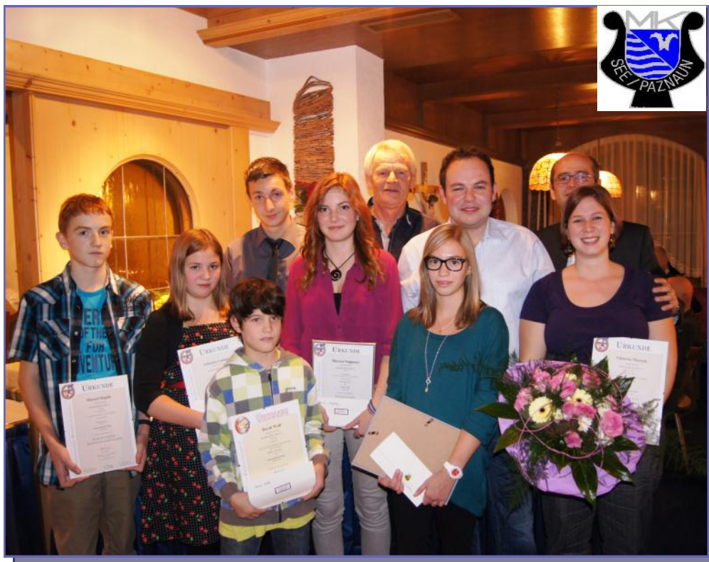
Cäciliafeier 2012