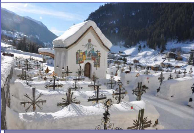
Friedhof 18.02. 2012