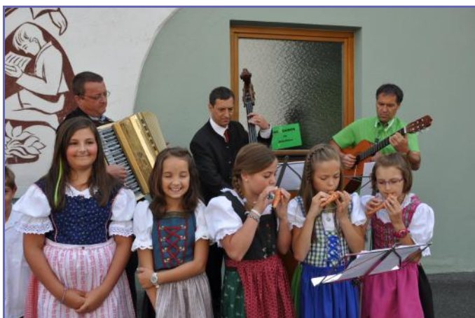
Ständchen VS See