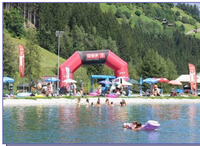
Radio Tirol Sommerfrische

hier den 20. August, an welchem in Zusammenarbeit mit dem Tourismusverband die Radio Tirol Sommerfrische live vom Wasserpark See übertragen wurde. So ging der heißeste Tag des Jahres mit einer tollen Werbung für unser(n) „See“ über die Bühne.