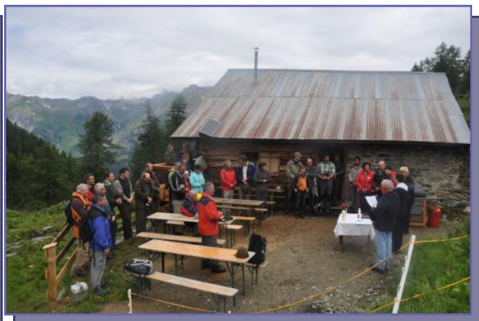
Alpe Großgfall 14. 07.2012