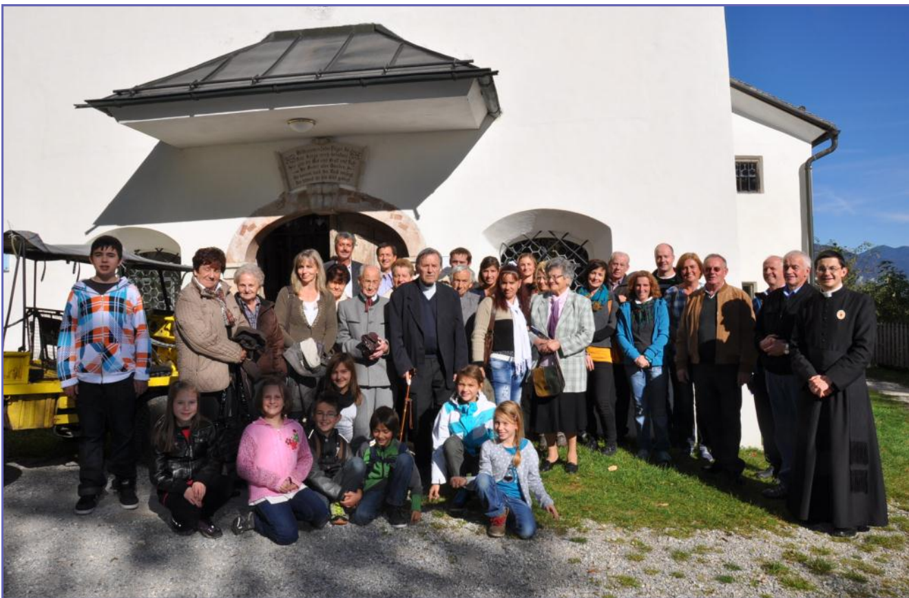
Wallfahrt Maria Brettfall

Pfarrgemeinderat und Pfarrkirchenrat (die in großem Einsatz für die Pfarre Zeit und Energie investieren, damit alles so rund läuft, wie jetzt), den Mesnern, den VorbereiterInnen, den Kirchenschmückerinnen und Putzerinnen (man muss nur einmal unser Gotteshaus näher betrachten, dann fällt auf, mit welcher Liebe sie ihren Dienst verrichten), den Vereinen und Organisten (die den Gottesdiensten eine besondere Feierlichkeit geben),... Es wären hier noch viele zu nennen, das sprengt aber heute unseren Rahmen, so sei allen noch einmal für ihren Dienst und Einsatz von Herzen gedankt. Es ist schön zu sehen, dass die Gemeinde all die Jahre hindurch den Weg