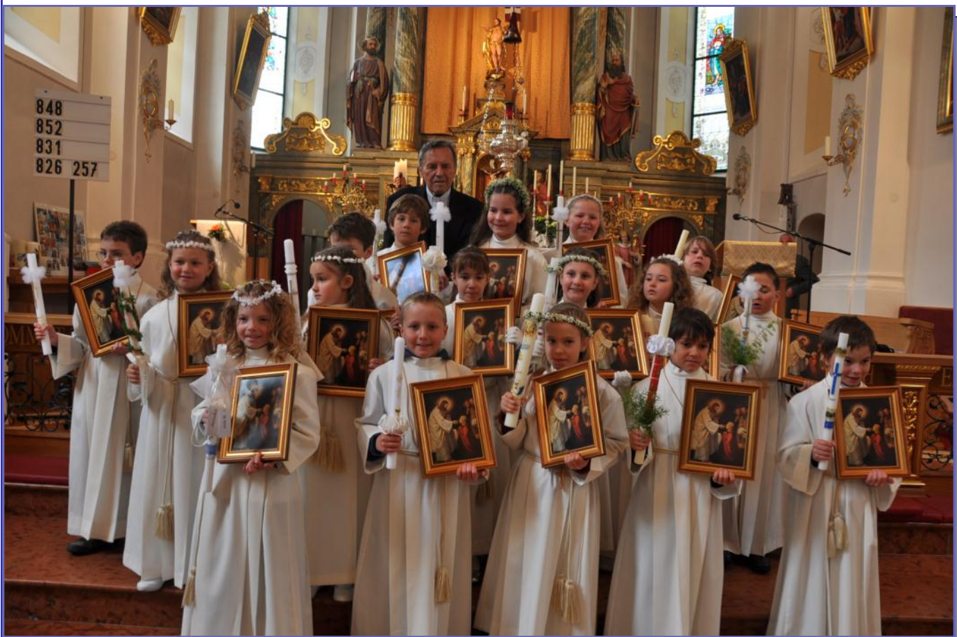
Erstkommunion 2012 (Bild: Lenz)