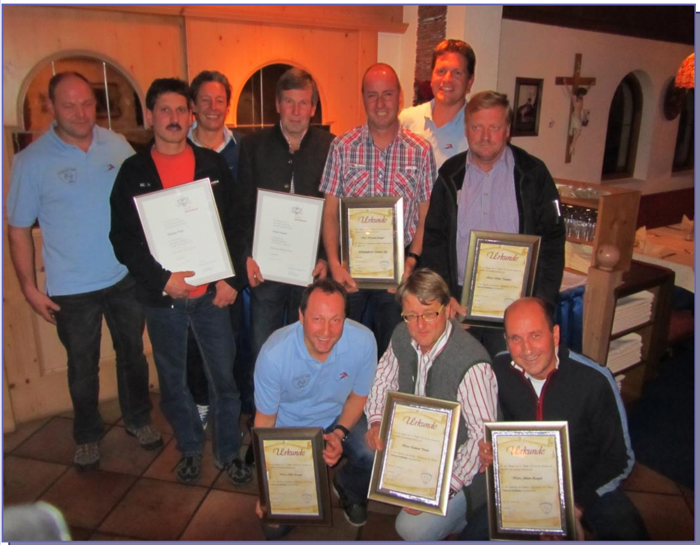
Ehrungen JHV 2012