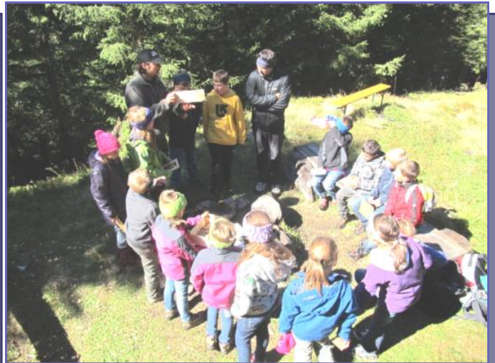
Waldtag mit der 4. Klasse der VS See