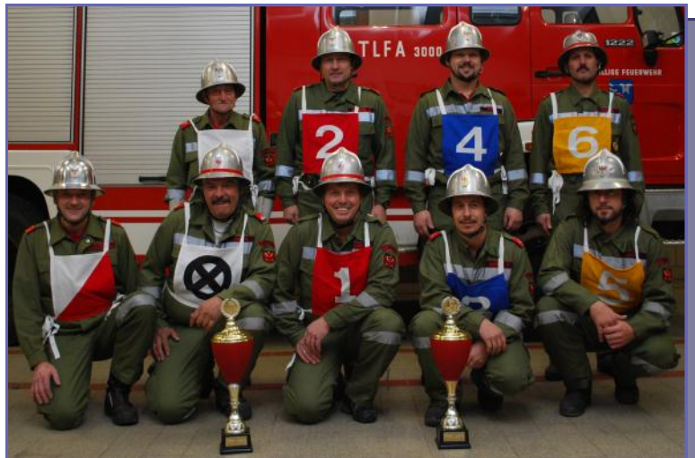
Abschnitts- und Bezirkssieger SEE I

Allen Feuerwehrmännern und freiwilligen Helferinnen und Helfern, die uns bei der Ausrichtung des diesjährigen Bezirksnassleistungswettbewerbs unterstützt haben, im Namen der gesamten FF See ein herzliches Vergelt's Gott. Gratulation an die Bezirksamtsgruppe See I für die erfolgreiche Teilnahme bei diesem Wettbewerb – sie wurden sowohl Abschnittssieger, als auch Bezirkssieger.