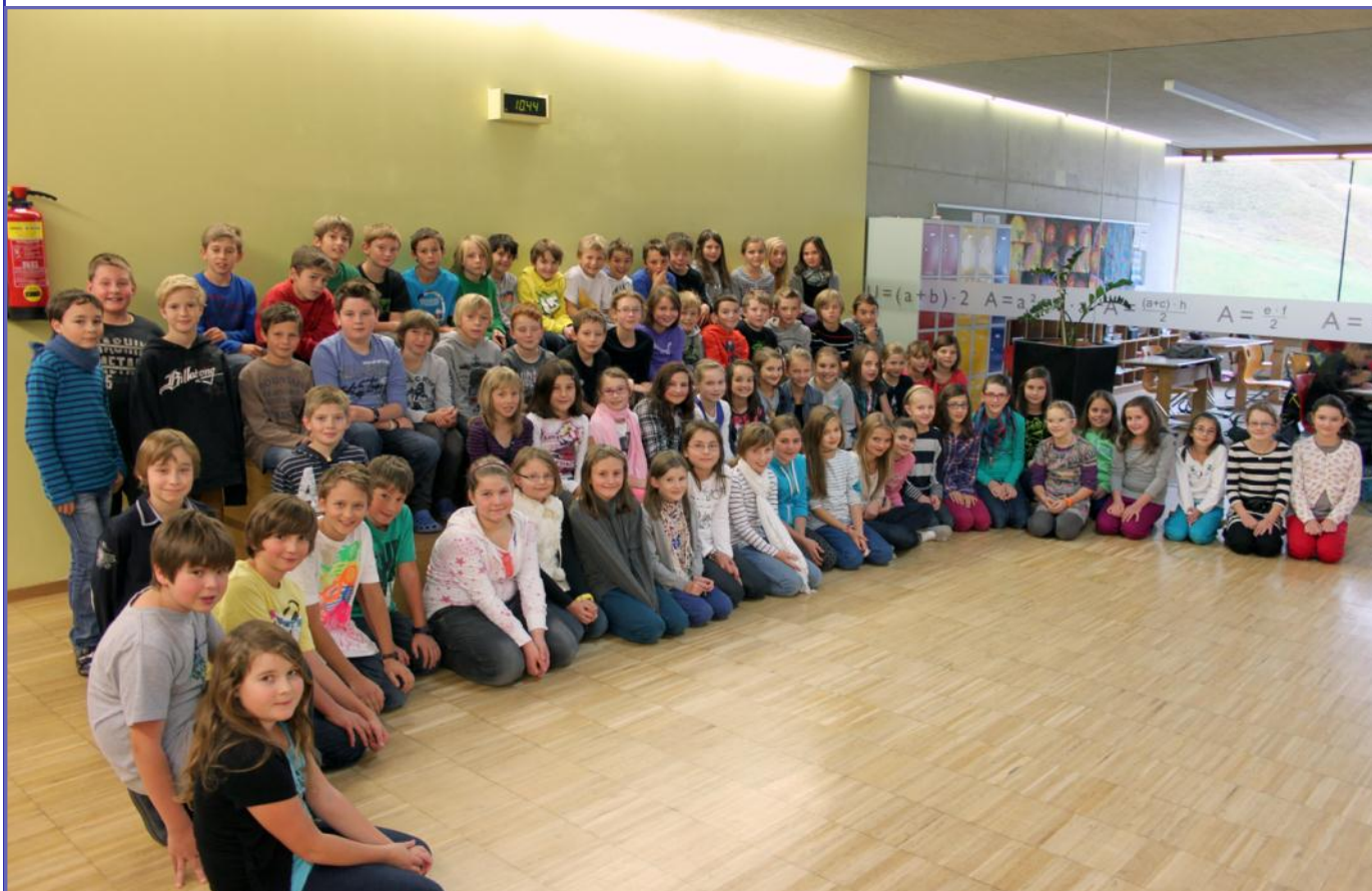
Mit dem Schuljahr 2012/2013 beginnt für 77 Schüler/innen in vier ersten Klassen die Neue Mittelschule