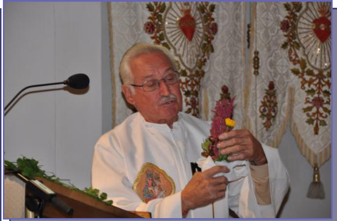
Einzug Primizamt sowie Glückwünsche und Geschenkübergaben