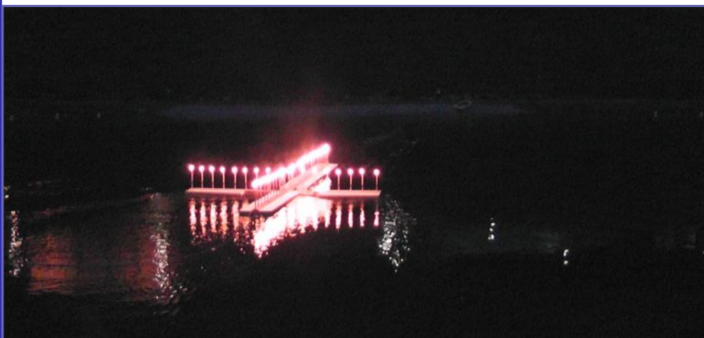
„Seefeuer“ am Badesee

Die angeführten Ausrückungen stellen nur einen kleinen Teil des Terminkalenders unserer Kompanie dar. An dieser Stelle möchte ich mich ganz herzlich bei meinen Marketenderinnen, Schützenkameraden und Jungschützen für ihren Einsatz bei sämtlichen Ausrückungen und Veranstaltungen bedanken.